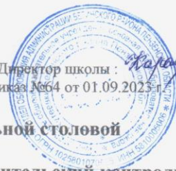
График посещения школьной столовой комиссией, осуществляющей родительский контроль